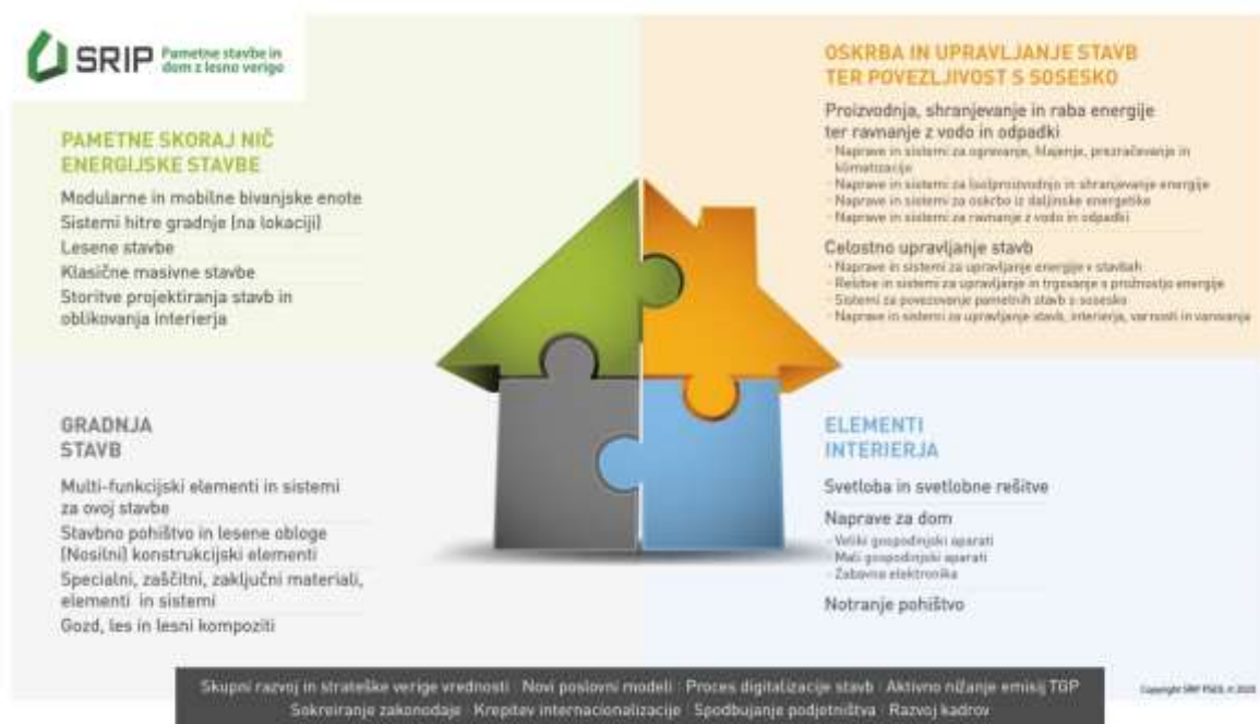
Slika: Fokusna področja in produktne smeri prenovljenega AN SRIP PSIDL 2020 - 2023

Ta so zaznana na različnih področjih delovanja in so posledica zaznanih tehnoloških in družbenih trendov, kadrovskih potreb na trgu in zakonodajnih ter okoljevarstvenih izzivov: skupni razvoj in strateške verige vrednosti, novi poslovni modeli, proces digitalizacije stavb, aktivno nižanje emisij TGP, sokreiranje zakonodaje, krepitev internacionalizacije, spodbujanje podjetništva in razvoj kadrov . Za horizontalna in skupna področja delovanja je značilno, da po svoji vsebini presegajo področja posameznih produktivnih smeri in fokusnih področij. Nemalokrat so te vsebine lastne več SRIP-om (seveda s svojstvenim pridihom).